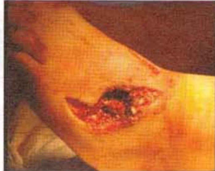
A victim of MKO and NLA terrorist operations in Tehran